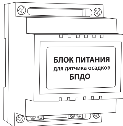
Внешний вид блока питания для датчика осадков БПДО

Блок питания датчика осадков предназначен для использования в системах обогрева совместно с датчиком осадков, обеспечивая необходимое напряжение питания резистивного нагревательного элемента датчика.